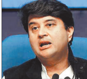
कंपनी का परिचालन लाभ दहाई अंक में बढ़ाने की उम्मीद

केंद्रीय दूरसंचार मंत्री ज्योतिरादित्य सिंधिया ने कहा कि सार्वजनिक क्षेत्र की कंपनी भारत संचार निगम लिमिटेड (बीएसएनएल) अगले वित्त वर्ष में 50,000 से 60,000 और मोबाइल टावर जोड़कर मजबूत नेटवर्क तैयार करेगी। केंद्रीय मंत्री सिंधिया ने कहा कि कंपनी का परिचालन लाभ चालू वित्त वर्ष में दहाई अंक में बढ़ने की उम्मीद है। सिंधिया ने बताया कि बीएसएनएल ने 4जी नेटवर्क बनाने में एक साल में अब तक का सबसे बड़ा पूंजीगत निवेश 20,000 करोड़ रुपये का किया है, जिसे जल्द ही 5जी नेटवर्क में अद्यतन किया जाएगा। सिंधिया ने "टाइम्स नाउ समिट" में कहा, "आज बीएसएनएल के एक लाख टावर काम कर रहे हैं, जो हमारी स्वदेशी और आत्मनिर्भर 4जी प्रौद्योगिकी से सिग्नल भेज रहे हैं। इसी आधार पर अब हम नेटवर्क का विस्तार करने की योजना बना रहे हैं। कुल 98,000 टावर लगभग तैयार हो चुके हैं। हम इसे 50,000 से 60,000 और टावर जोड़कर और मजबूत बनाना चाहते हैं, ताकि नेटवर्क पूरी तरह से टिकाऊ रहे और फिर इसे बहुत तेजी से 5जी में बदला जा सके। केंद्रीय मंत्री ने कहा कि 5जी नेटवर्क में बदलाव उतना कठिन नहीं होगा क्योंकि बीएसएनएल का नेटवर्क पूरी तरह से आत्मनिर्भर 4जी प्रौद्योगिकी पर आधारित है।