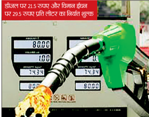
डीजल पर 21.5 रुपए और विमान ईंधन पर 29.5 रुपए प्रति लीटर का निर्यात शुल्क

सरकार ने पेट्रोल और डीजल पर उत्पाद शुल्क में 10-10 रुपए प्रति लीटर की कटौती की है। इस कदम से पश्चिम एशिया संकट के कारण कच्चे तेल की बढ़ी वैश्विक कीमतों से घरेलू उपभोक्ताओं को राहत दी गई है। अधिसूचना के अनुसार इसके साथ ही सरकार ने डीजल और विमान ईंधन (एटीएफ) के निर्यात पर शुल्क लगा दिया है। सरकार ने डीजल के निर्यात पर 21.5 रुपए प्रति लीटर और विमान ईंधन पर 29.5 रुपए प्रति लीटर का निर्यात शुल्क लगाया है। पेट्रोल पर विशेष अतिरिक्त उत्पाद शुल्क 13 रुपए प्रति लीटर से घटाकर तीन रुपए कर दिया गया है, जबकि डीजल ►►शेष पेज 4 पर